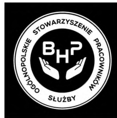
3. Wersja achromatyczna